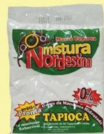
Massa para tapioca Nordestina 500 gr