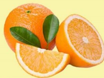
Laranja Serra D'água